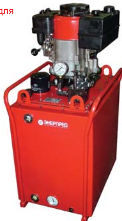
На фото: модель НБР-5,0И100-1-Т с термометром