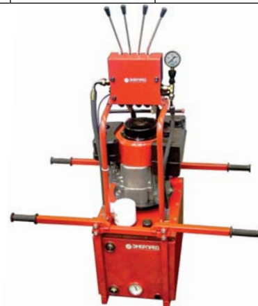
фото: модель НБР35-5,0Д4Д40-1-СТ со складывающимися ручками, термометром и блоком управления на 4 домкрата