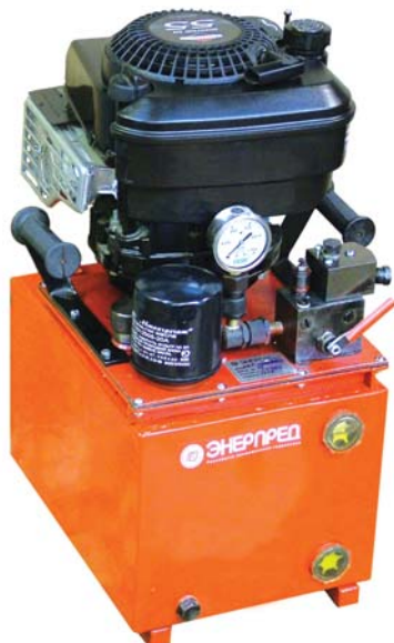
На фото: базовая модель НБР-1,6А10-1

Станции серии НБР предназначены для проведения работ в условиях отсутствия энергосети. Вращение насоса осуществляется одноцилиндровым четырехтактным бензодвигателем воздушного охлаждения. Управление гидравлическим оборудованием осуществляется ручным разгрузочным краном или ручным 3-позиционным распределителем, установленными на насосной станции.