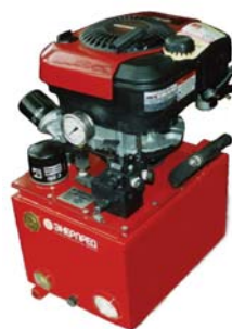
На фото: модель НБР-2,4 с термометром